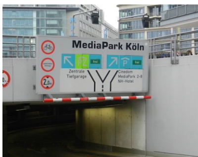
Abb. 3: Tiefgarageneinfahrt 2

Abb. 2: Aufgang 4d Vom Hansaring in die Straße „Am Kümpchenshof“ abbiegen. Nach ca. 70 m (in einer Linkskurve) nehmen Sie (geradeaus) die Einfahrt zur Tiefgarage des MediaParks ( Abb. 3 ). Dort (in einer Gabelung) zunächst rechts einordnen ( Abb. 4: Richtung Cinedom, P1+2 ), dann links abbiegen ( Abb. 5: Richtung MediaPark P3-8 / KölnTurm / NH-Hotel ). Nach ca. 20 m scharf rechts abbiegen, in den gelb markierten Bereich MediaPark 4/P4. An der Schranke ziehen Sie ein Ticket (wird später für die Ausfahrt bei INTERSOM entwertet), folgen nach Passieren der Schranke der Fahrbahn ca. 60 m bis zum Ende, biegen rechts ab und fahren bis zum Bereich 4d. Über den Aufgang 4d ( Abb. 2 ) erreichen Sie INTERSOM mit dem Aufzug (Ebene E2 bzw. 3. Etage).