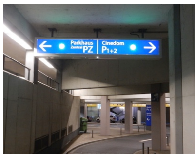
Abb. 4: Tiefgarageneinfahrt 2, erste Gabelung